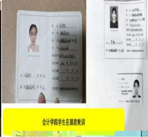
会计学院学生在课堂轮训